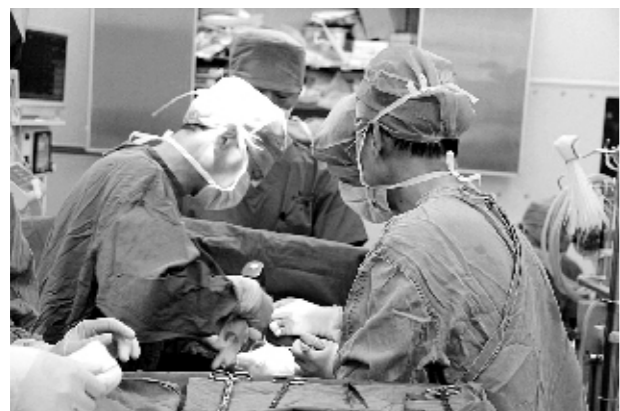
图为紧张的手术现场

本报讯(记者 李苒 通讯员 邢永田)日前，两名贫困先天性心脏病患儿在河南省人民医院心血管外科办理了出院手续，得到免费救治。